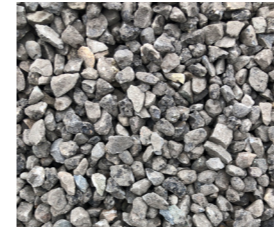
8-16 Splitt / Chippings / Fragments Menge / Quantity / Quantité : ca. / approx. / env. 24% Bindemittelgehalt / Binding agent content / Teneur en liant : 1% (No. 30.1/31.1)