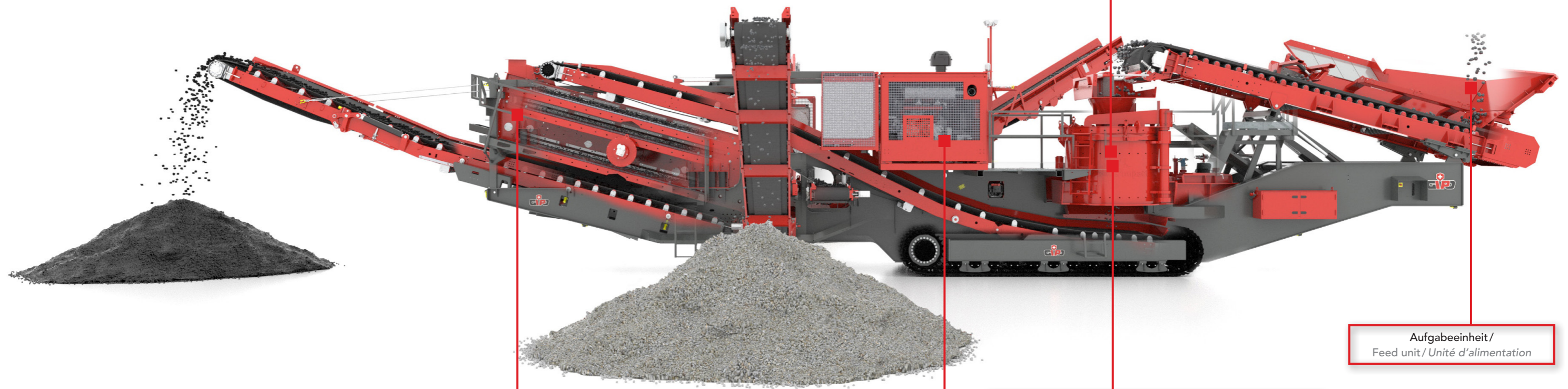
Siebeeinheit bis 3-Deck/ Screen unit up to 3 decks / Cribleur avec jusqu'à 3 étages