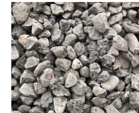
16-22 Splitt / Chippings / Fragments Menge / Quantity / Quantité : ca. / approx. / env. 5% Bindemittelgehalt / Binding agent content / Teneur en liant : 0.7% (No. 30.1/31.1)

Aufgabe / Feed / Alimentation : 4-22mm Bis ca. / Up to approx. / Jusqu'à env. : 100 t/h