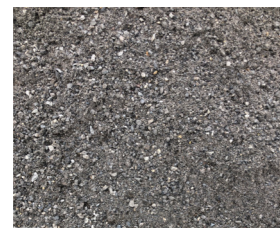
0-4 Sand / Sand / Sable Menge / Quantity / Quantité : ca. / approx. / env. 37 % Bindemittelgehalt / Binding agent content / Teneur en liant : 5.8% (No. 30.1/31.1)