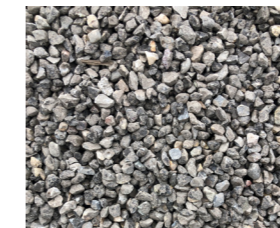
4-8 Splitt / Chippings / Fragments Menge / Quantity / Quantité : ca. / approx. / env. 34 % Bindemittelgehalt / Binding agent content / Teneur en liant : 1.5% (No. 30.1/31.1)