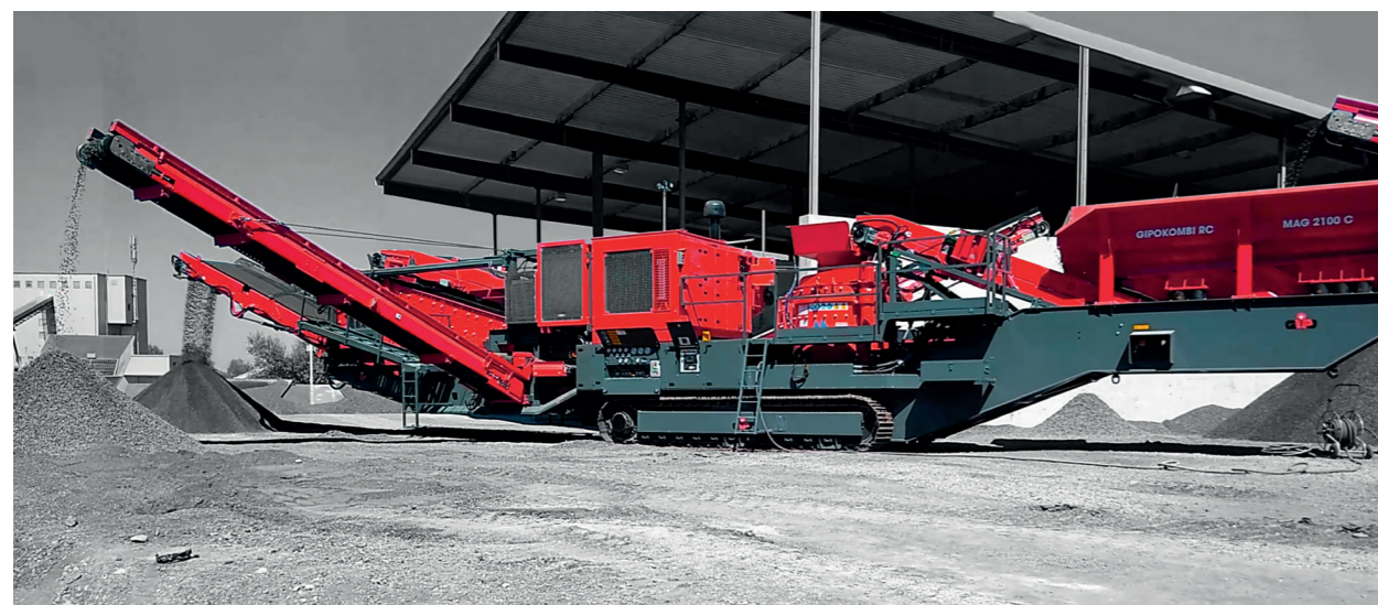
Raupenmobile Prallbrech- und Siebanlage mit Vertikal-Prallbrecher und 3-Deck Siebmaschine / Tracked impact crusher and screening plant with vertical impact crusher and 3-deck screening machine / Installation de concassage-criblage mobile sur chenilles avec concasseur à percussion vertical et cribleur à 3 étages