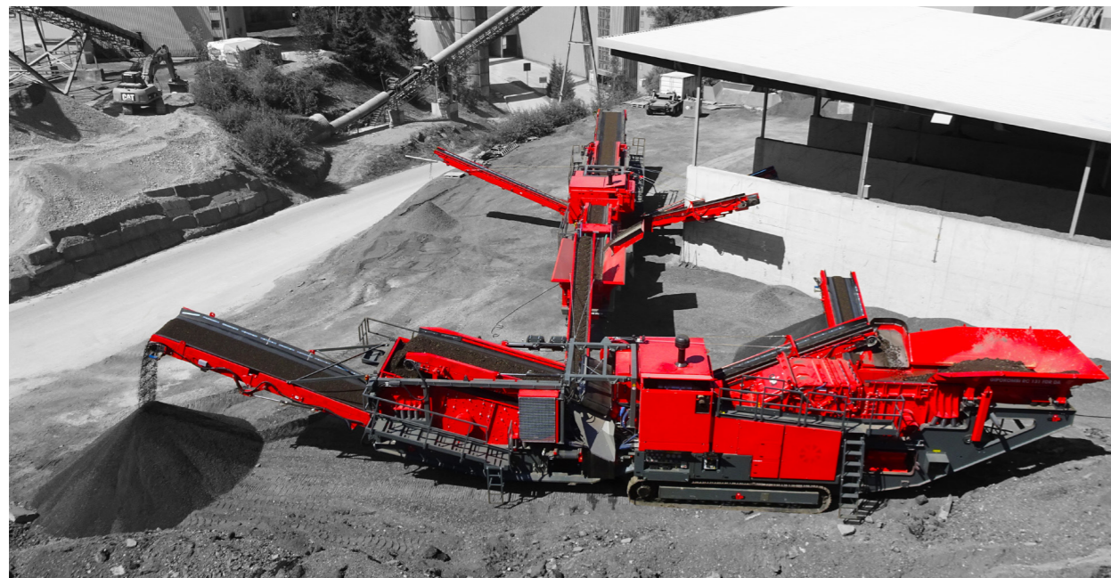
Raupenmobile Prallbrech- und Siebanlage mit Horizontal-Prallbrecher und 3-Deck Siebmaschine / Tracked impact crusher and screening plant with horizontal impact crusher and 3-deck screening machine / Installation de concassage-criblage mobile sur chenilles avec concasseur à percussion horizontale et cribleur à 3 étages