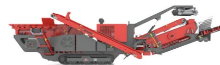
Décharge FE longitudinale